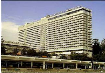
ГРАНД ОТЕЛЬ «ЖЕМЧУЖИНА» г. Сочи, ул. Черноморская, 3