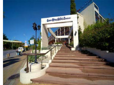
СОЧИ БРИЗ ОТЕЛЬ