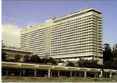
ГРАНД ОТЕЛЬ «ЖЕМЧУЖИНА» г. Сочи, ул. Черноморская, 3